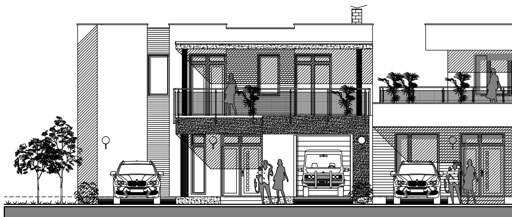
POHLAD JUHOVÝCHODNÝ M 1:100