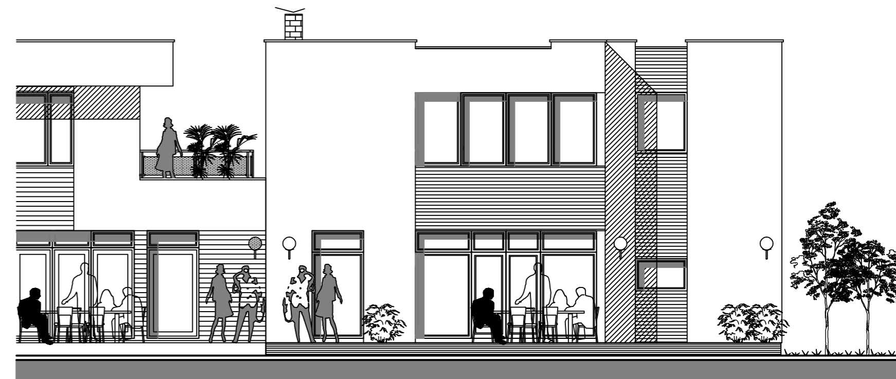
POHLAD SEVEROZÁPADNÝ M 1:100